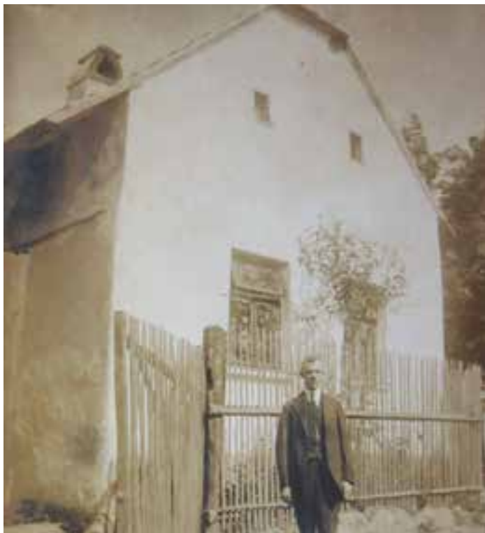
Dům na místě současné prodejny COOP