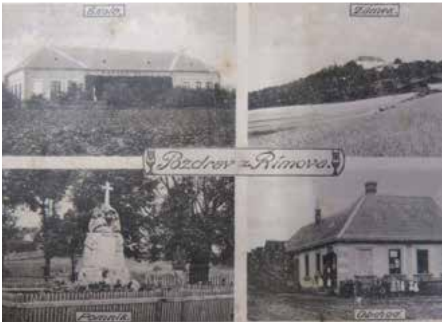
Pozdrav z Římova