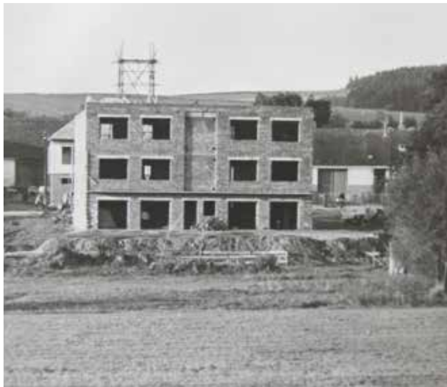
Rozestavěný bytový dům č.p. 126