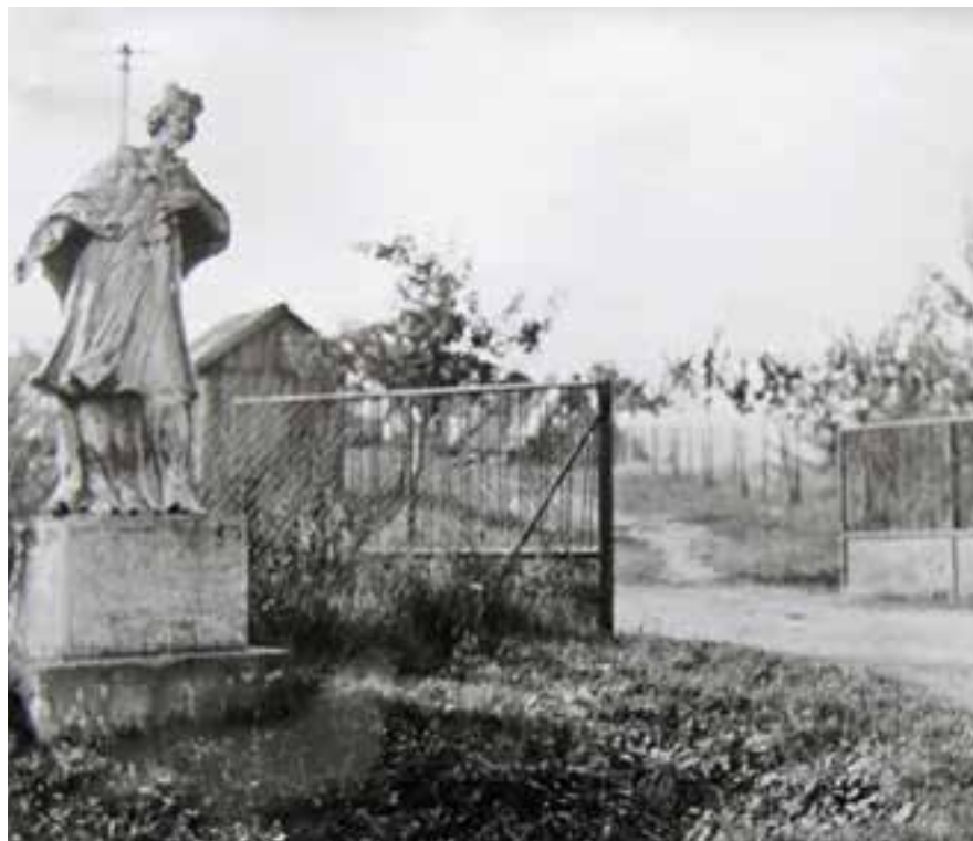
Vjezd do areálu JZD Římov se sochou sv. Jana Nepomuckého