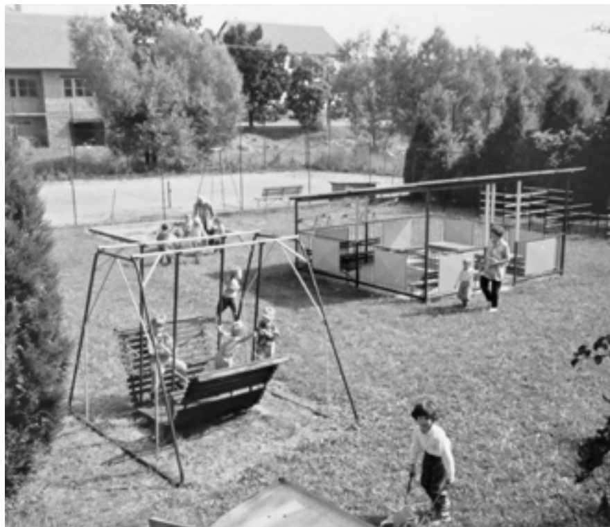
Dětské a víceúčelové hřiště