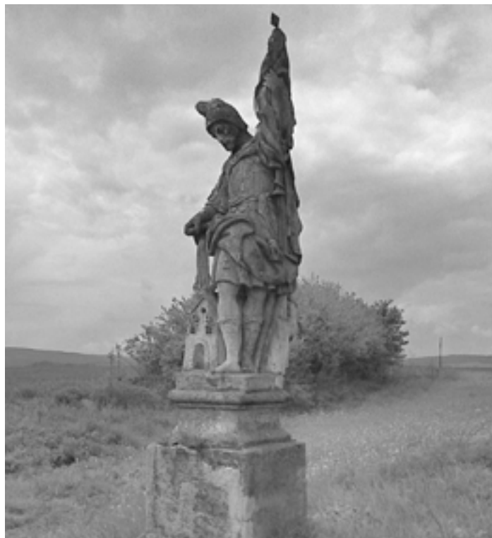
Socha sv. Floriána