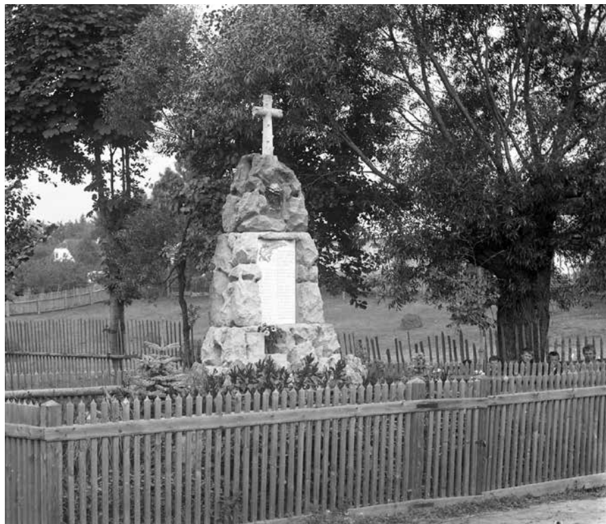
Pomník padlých v 1. světové válce