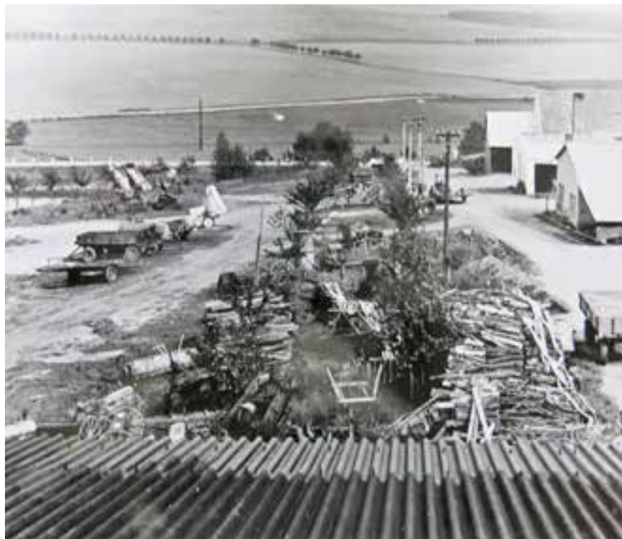
Areál JZD Římov