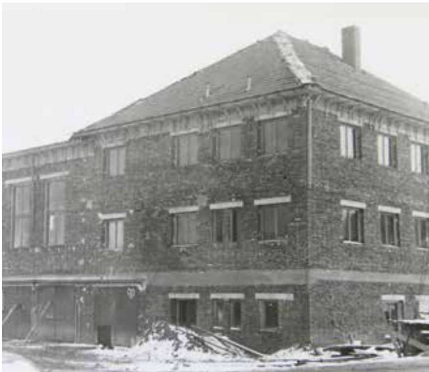
Rozestavěný kulturní dům