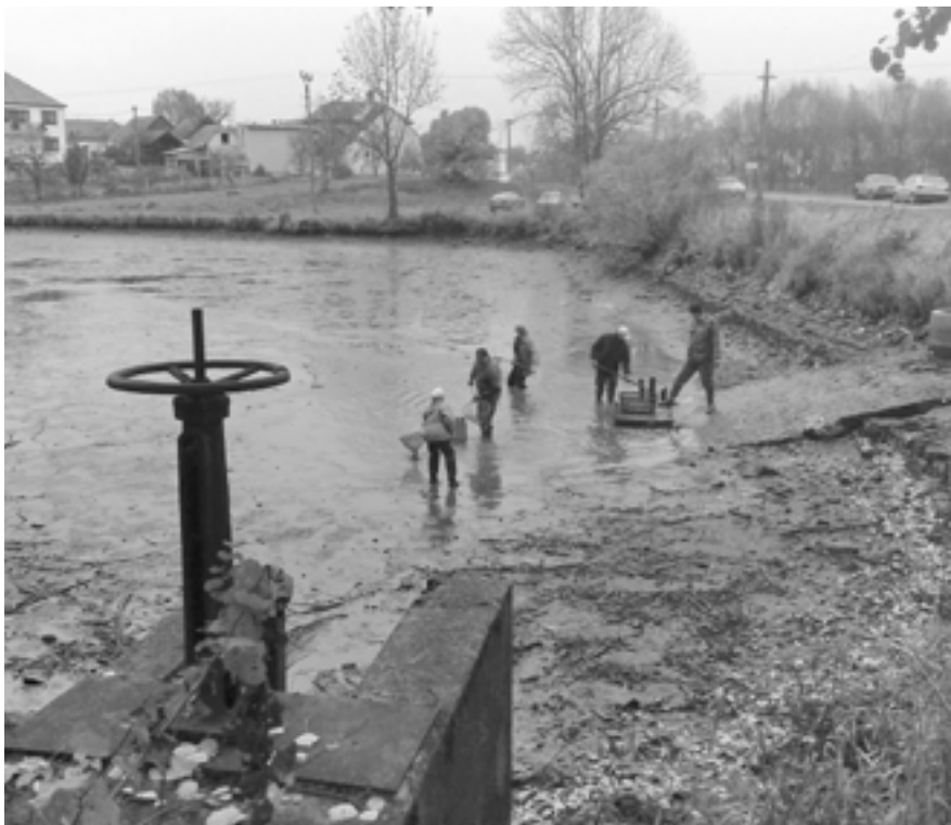
Výlov rybníka U sv. Jana