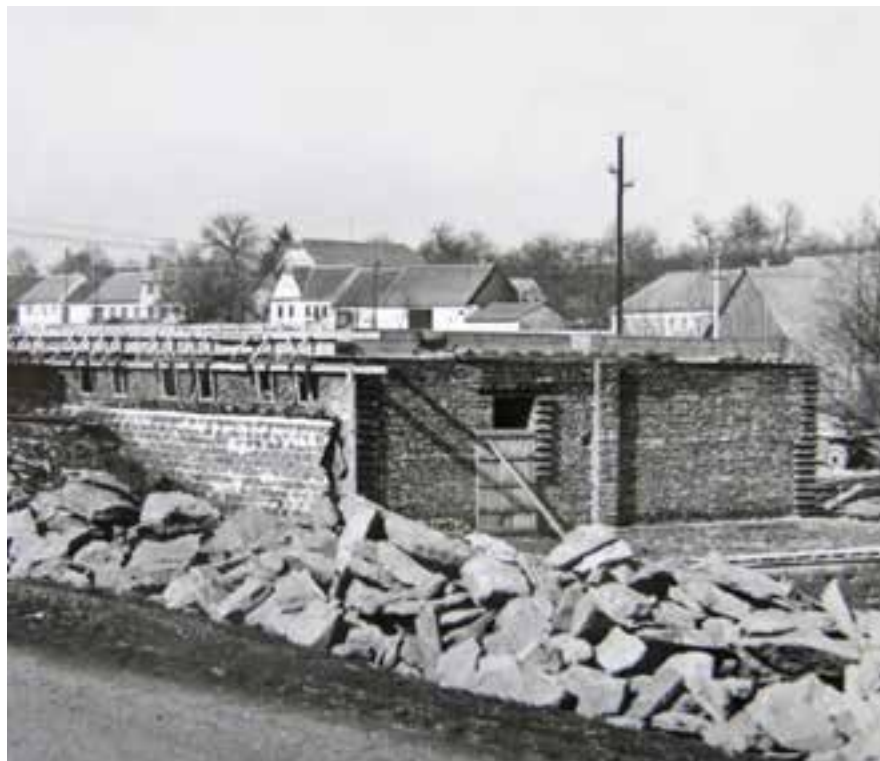
Rozestavěný kulturní dům