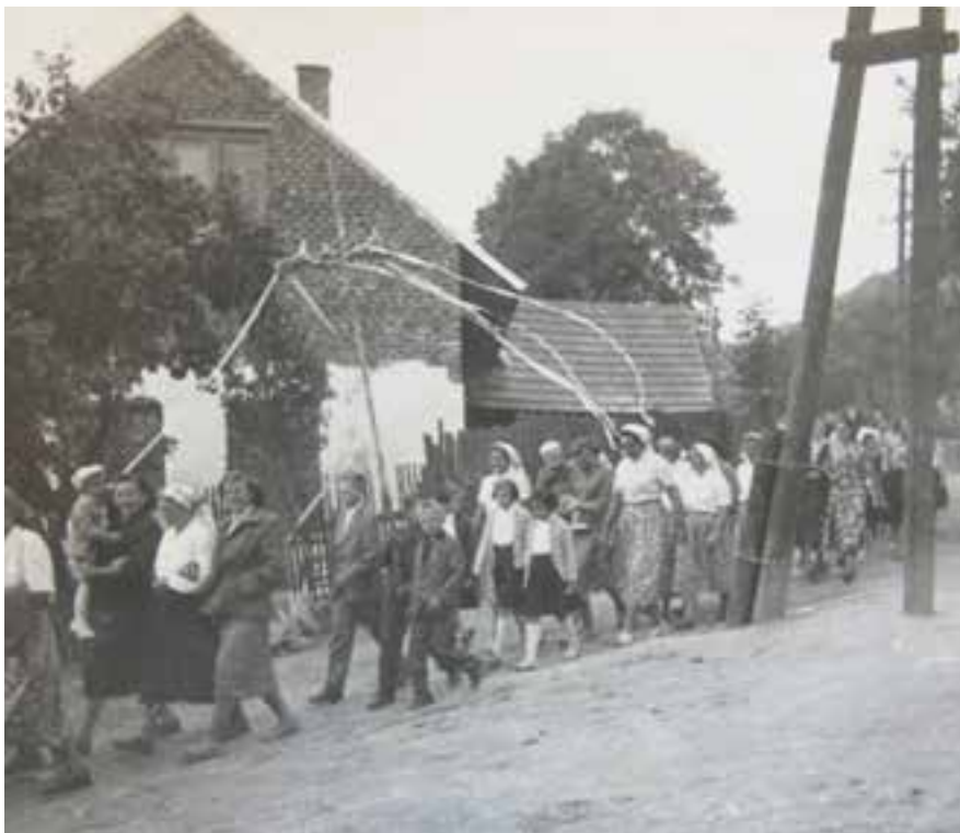
Dožínky – průvod obcí na křižovatce u č.p. 51 a č.p. 124