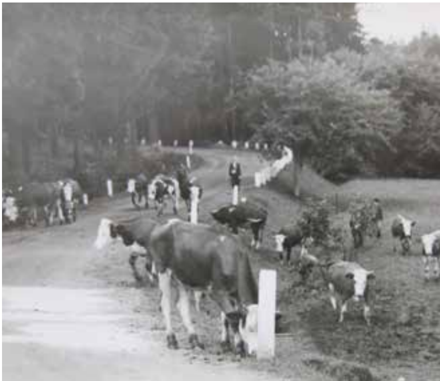
Silnice směr Želetava před vjezdem do lesa