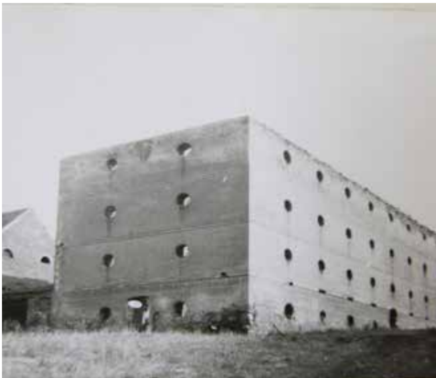
Sýpka na Vískách