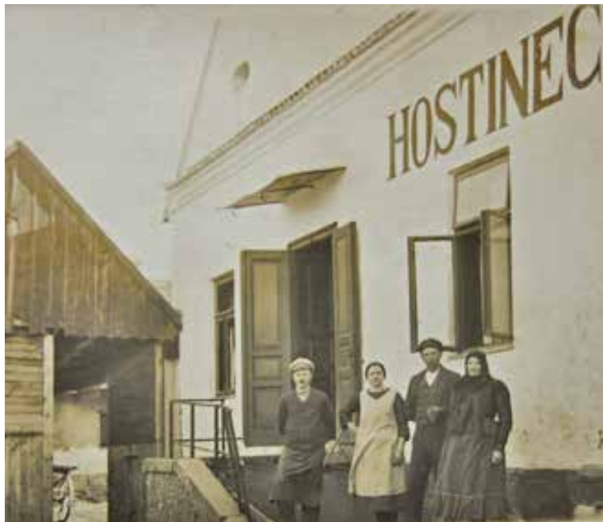
Hostinec U Čurdů č.p. 4