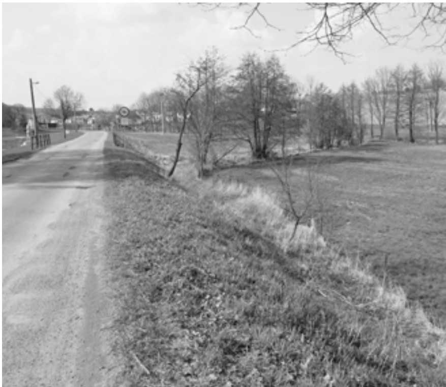
Vjezd do obce před stavbou ČOV