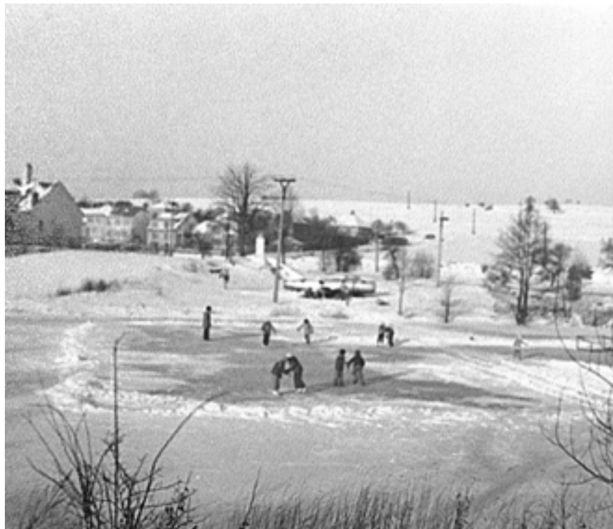
Rybník U sv. Jana