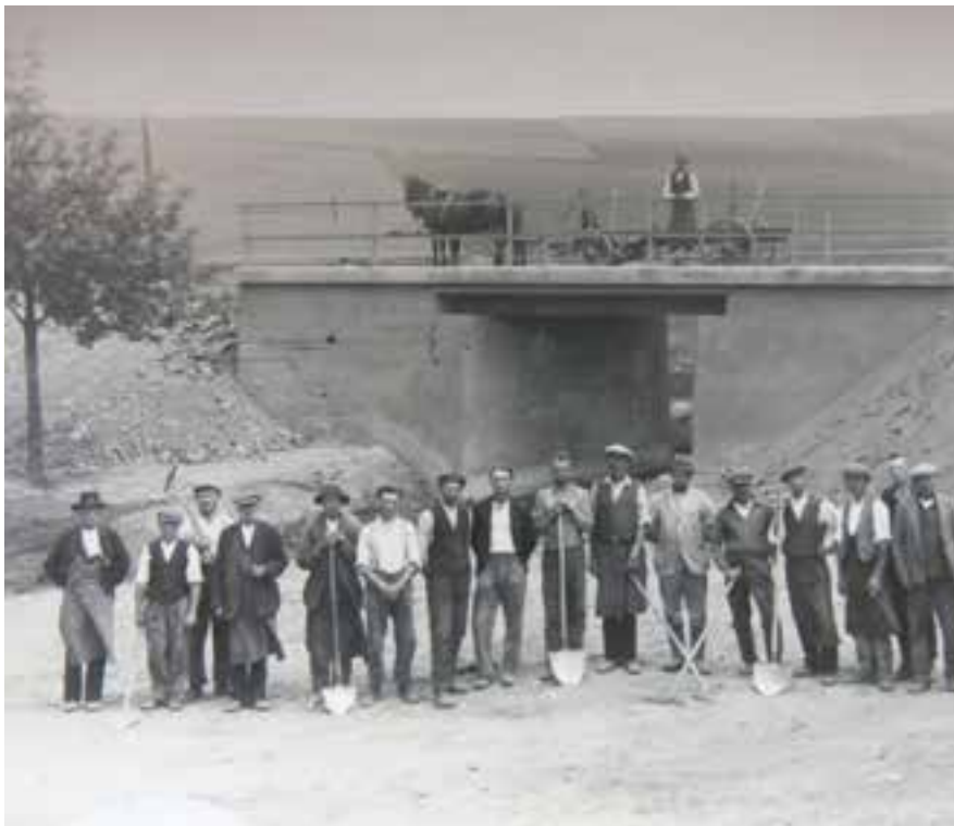
Stavba mostu směr Čáslavice