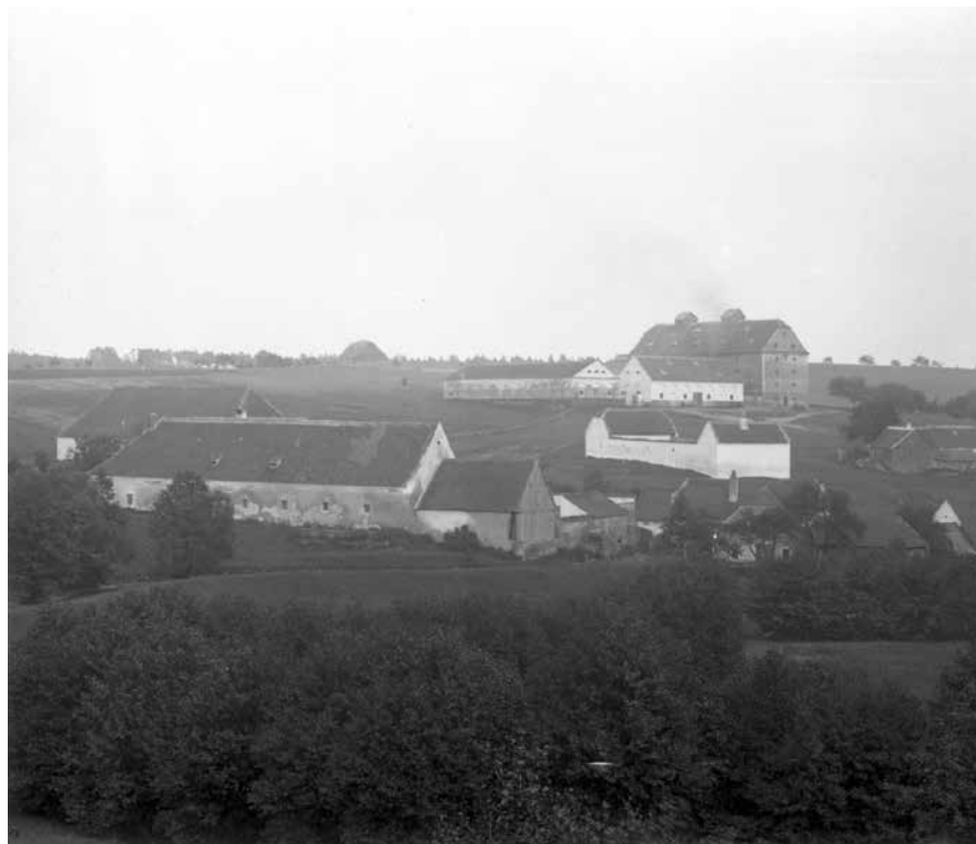
Římov - Vísky